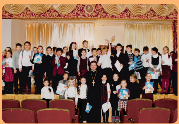
Світлина на згадку про зустріч