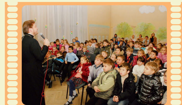
Діти гімназії ім. Тараса Шевченка правильно назвали всі картини вікторини