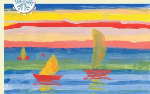
«Човни», ЗОШ № 90, Євген Малишевський