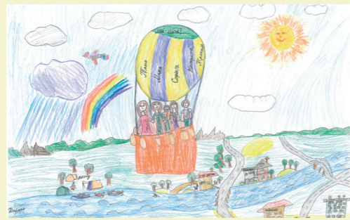
«Мій чарівний світ», Печерська гімназія № 75, Макачук Софія