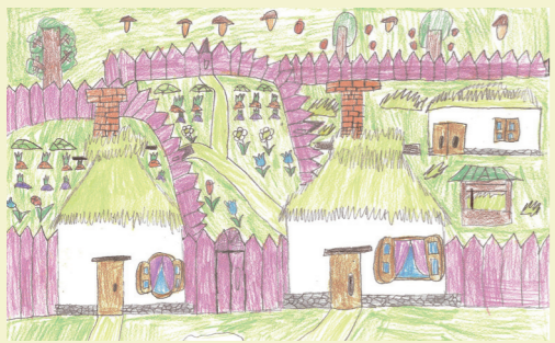
«Хатинки козаків», ЗОШ № 90, Яків Коломієць

Парафія храму на честь Різдва Пресвятої Богородиці на чолі зі своїм настоятелем отцем Олегом планує і надалі сприяти розвитку здібностей учнів і виховання дітей в дусі християнських цінностей. ■