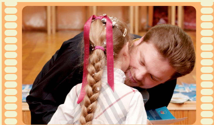
Кловський ліцей: як зберегти життя для щастя?