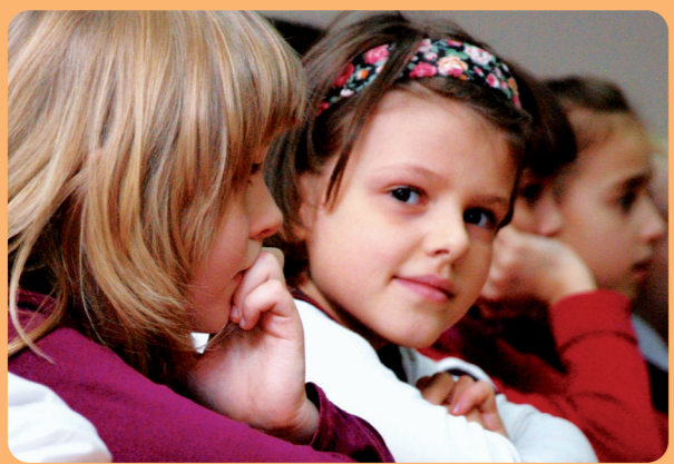
Роздуми малечі під час зустрічі зі священником