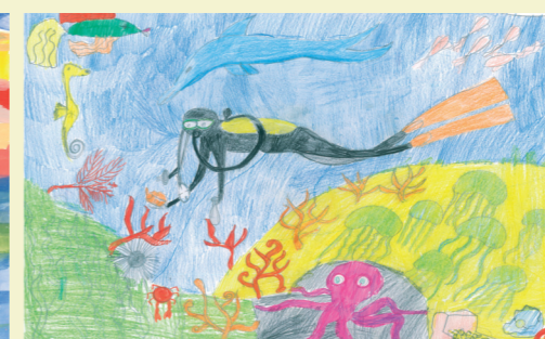
«Я та океан», ЗОШ № 90, Кур'ято Стася