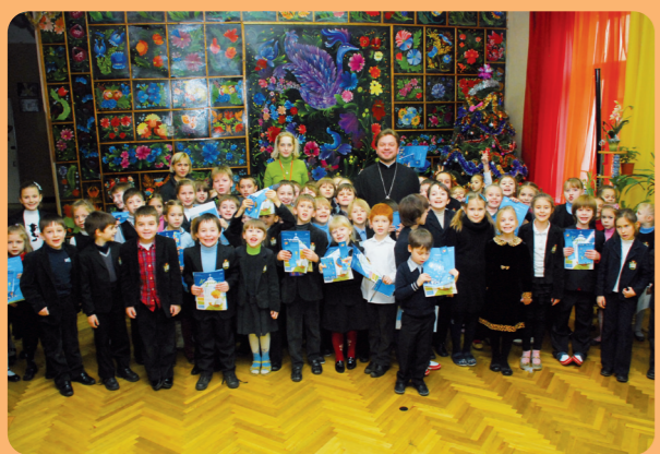
В гімназії №75 ніхто не залишився без подарунка